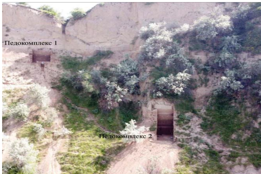
Фото 1. Лёссово-почвенный разрез Хонако-III. Культурный слой среднепалеолитической стоянки во втором педокомплексе (нижний раскоп).